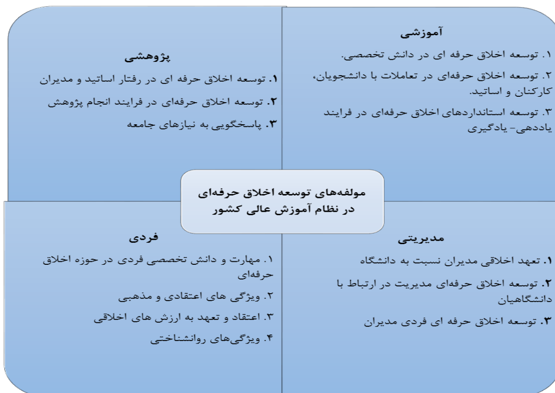
شکل ۳: مدل مفهومی مؤلفه‌های توسعه اخلاق حرفه‌ای در نظام آموزش عالی کشور

۶. گام ششم، حفظ کنترل کیفیت: شاید ارزیابی مطالعات برای دربرداشتن معیارهای کیفیت مهم‌تر از ارزیابی مطالعات برای دربرداشتن معیارهای شمول و مرتبط بودن، است. در روش فراترکیب و در این گام، رویه‌های زیر برای حفظ کیفیت مطالعه انتخابی در نظر گرفته شده‌اند: در فرایند پژوهش محقق تلاش می‌کند تا با فراهم آوردن توضیحات و توصیف روشن و واضح برای گزینه‌های موجود در پژوهش گام‌های اتخاذ شده را بردارد. پژوهشگران روش‌های کنترل کیفیت استفاده شده در مطالعه‌های تحقیق کیفی اصلی را به کار می‌برند، محققان با به کارگیری راهکار جستجوی الکترونیکی و دستی، مقالات مرتبط را پیدا می‌کنند. در زمان مناسب، محقق رویکردها و نگرش‌های مستقر را جهت تلفیق مطالعات اصلی در پژوهش کیفی استفاده می‌کند. در زمان مناسب، محقق از برنامه‌های مستقر و محرز مانند ابزار حیاتی جهت ارزیابی کیفیت مطالعات اصلی پژوهش کیفی استفاده می‌کند. در این پژوهش از ابزار حیاتی جهت ارزیابی فرایند فراترکیب