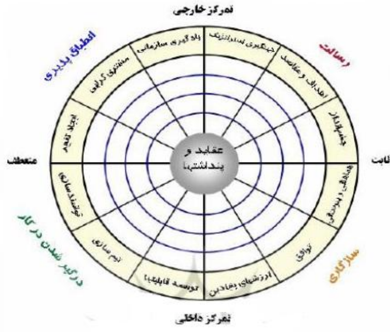
شکل (۱): ابعاد فرهنگ‌سازمانی