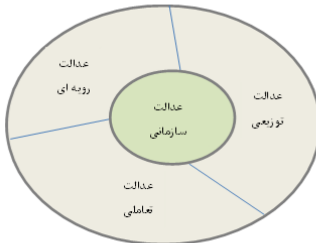
شکل (۲): ابعاد عدالت‌سازمانی